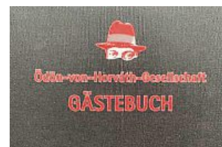
Das Gästebuch und einige Ausschnitte daraus.

Wobei sie die Auftritte nicht bewerten möchte. „Ich finde für mich kein High-