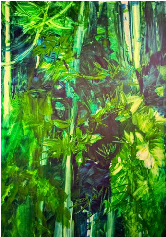
„Wald“ von Barbara Hauer

Diese Ausstellungen sind täglich von 15 - 20 Uhr geöffnet.